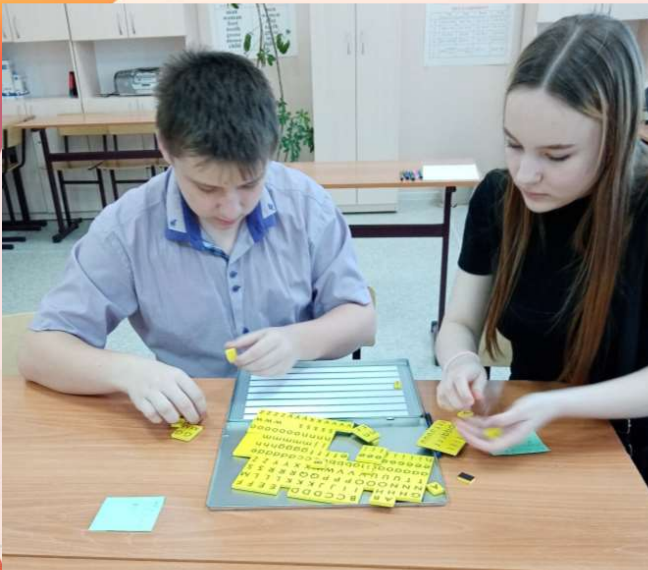
9а класс собирает имена