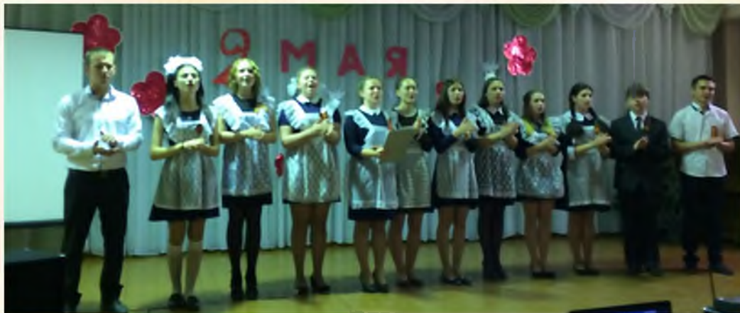
«День Победы!» - заключительная песня