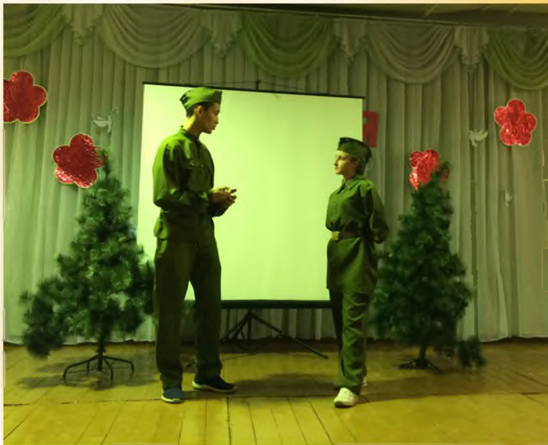
В. Катаев «Сын полка» – 8 класс