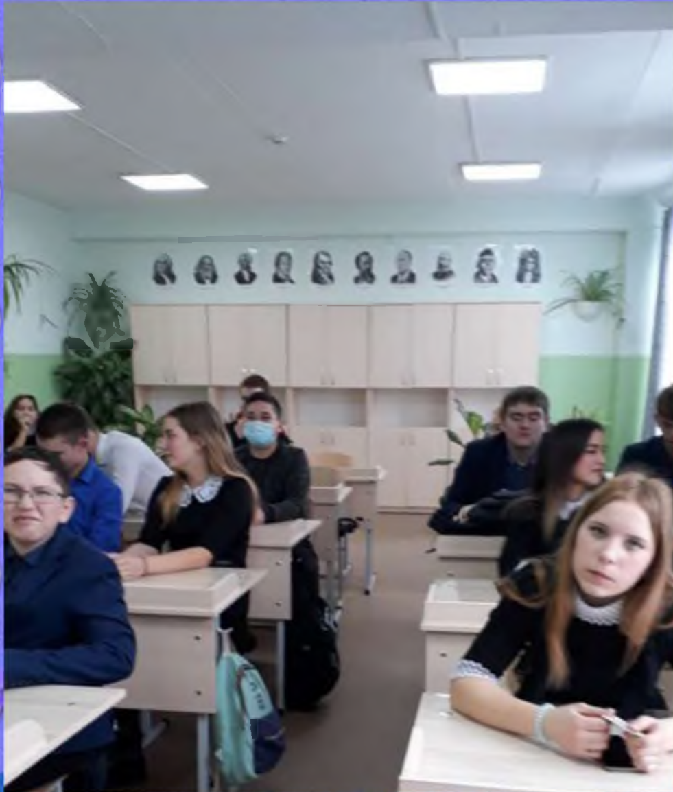
Акция «Плакат мира»