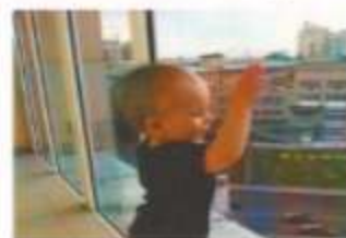
Вместе сохраним здоровье детей!

Не терпите бдительность, объясните ребенку, что опираться на окна нельзя, а тем более высовываться наружу.