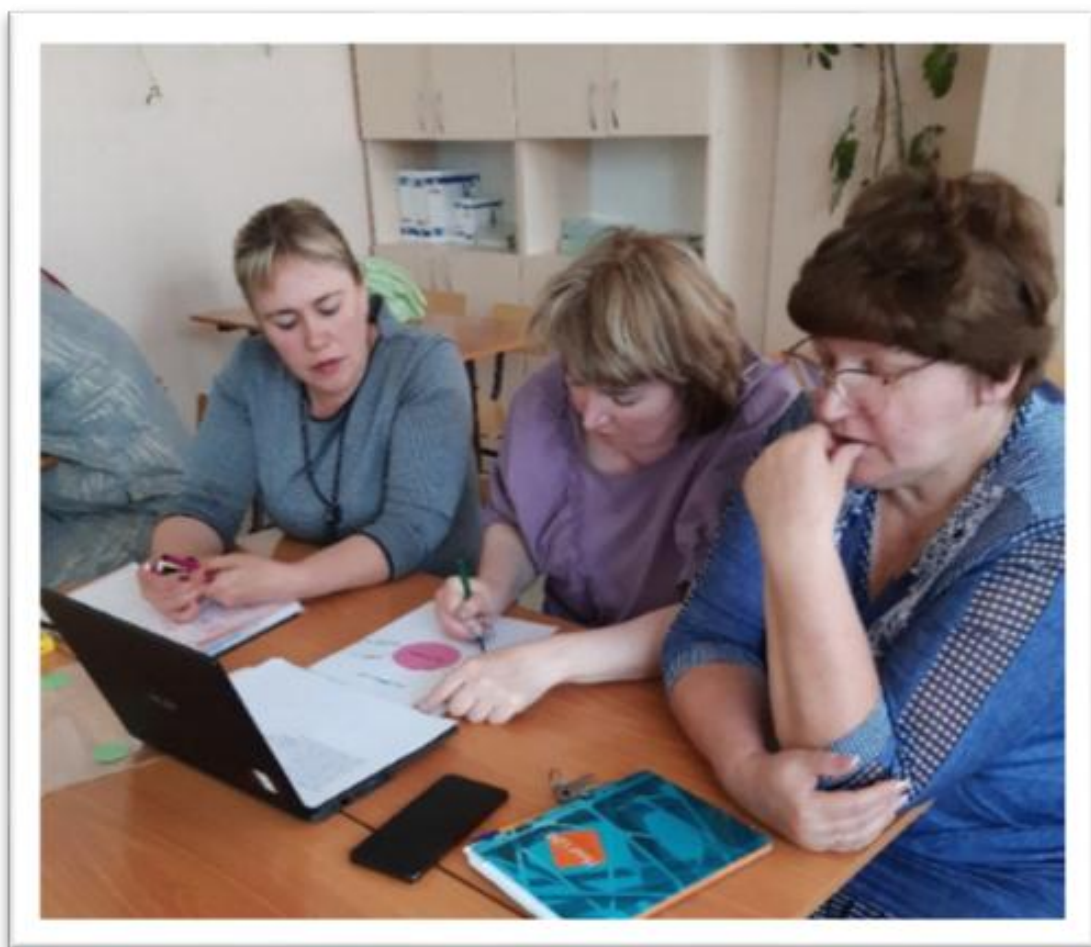
Участники семинара за работой

http://mischool.uoura.ru/index.php?start=5 –ссылка на сайт школы